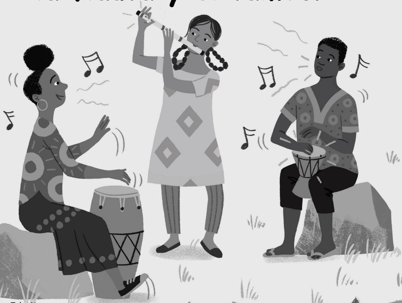
Ilustración: Toby Newsome